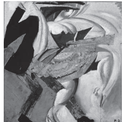
図版5 ヴィクトル・パリモフ《踊る女》 1920年（東京都現代美術館蔵）